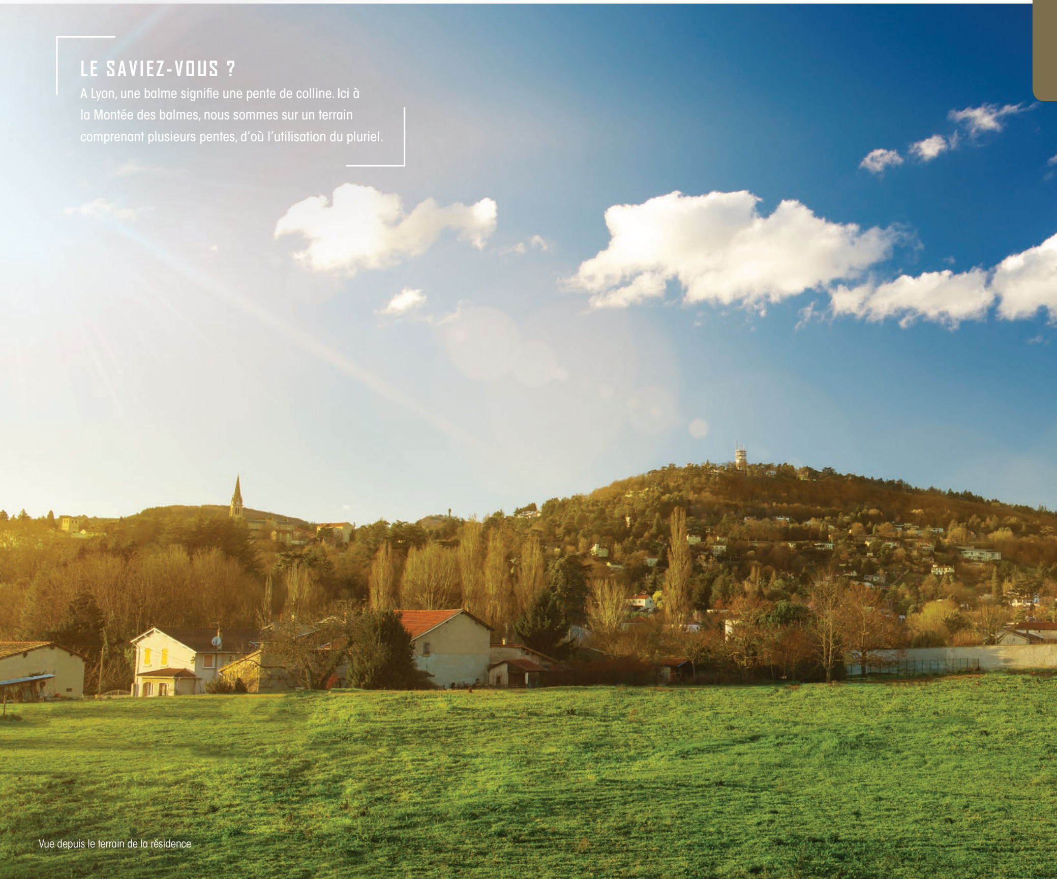
Vue depuis le terrain de la résidence

A Lyon, une balme signifie une pente de colline. Ici à la Montée des balmes, nous sommes sur un terrain comprenant plusieurs pentes, d'où l'utilisation du pluriel.