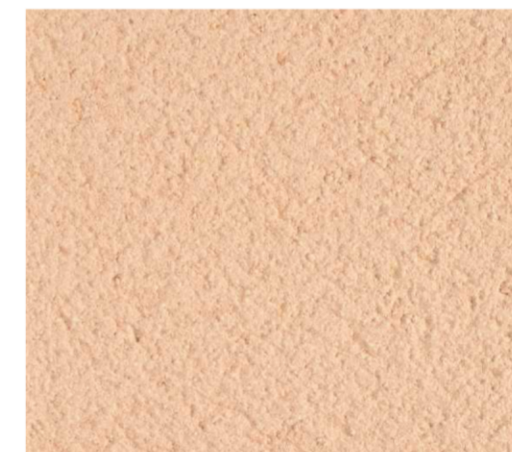
Enduit Parex R20